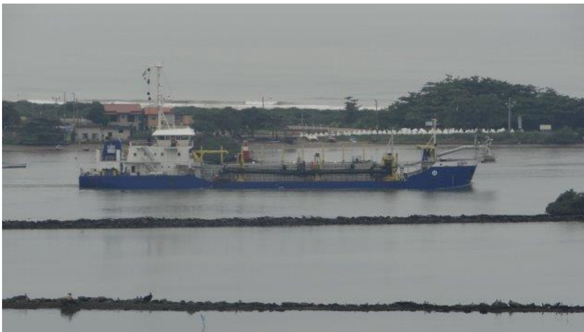
Imagem da Draga Catarina no canal de acesso ao Porto de Itajaí